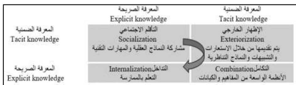
شكل (٢) نموذج SECI لإدارة المعرفة (Nonaka & Toyama, 2003)

وغالبًا ما يتم تصوير عمليات إدارة المعرفة على أنها تسلسل هرمي على شكل هرم قاعدته البيانات ورأسه الإجراءات ولكي يتم الوصول وتحويل البيانات إلى إجراء فيجب أن يتم تحويل البيانات لمعلومات ثم لمعرفة تمهيداً لعمليات اتخاذ القرار (Wilson, 2007)