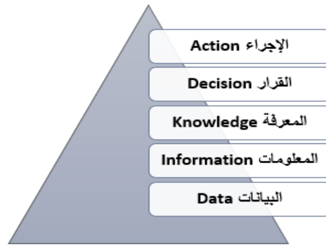
شكل (٣) نموذج ويلسون الهرمي لعمليات إدارة المعرفة (Wilson, 2007)

ويقترب علوي وليدندر (Alavi & Kane, 2008) من وجهة نظر ما يفعله شخص ما حول المعرفة، ويقترحان ما يصفانه بـ أربع مجموعات من عمليات المعرفة التي يتم تفعيلها اجتماعياً، وهي: (١) الخلق / البناء، (٢) التخزين / الاسترجاع، (٣) النقل، (٤) التطبيق، وقام هيسيج (Heisig, 2009) بتجميع جميع الأنشطة التي قام بتحليلها في الفئات الأكثر شيوعاً لإدارة المعرفة وهي: (١) تبادل المعارف، (٢) خلق المعرفة، (٣) استخدام المعرفة، (٤) تخزين المعرفة، (٥) تحديد المعرفة، (٦) اكتساب المعرفة، بينما قدم ستولينويرك (Stollenwerk, 2001) العمليات السبع التي تشكل جزءاً من نموذج إدارة المعرفة وهي: (١) تحديد المعرفة، (٢) التقاط المعرفة، (٣) اختيار المعرفة والتحقق من صحتها، (٤) تنظيم المعرفة وتخزينها، (٥) تبادل المعرفة، (٦) تطبيق المعرفة، (٧) خلق المعرفة.