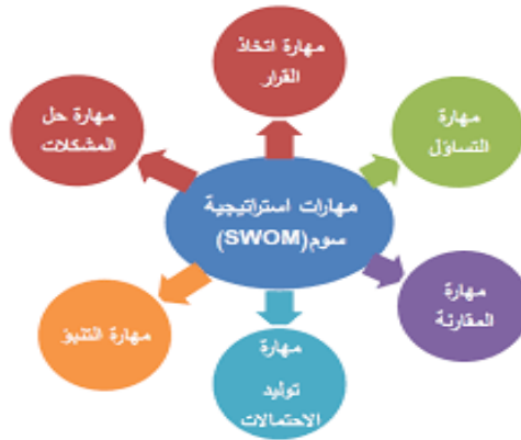
شكل (١) مهارات استراتيجية سوم (SWOM)