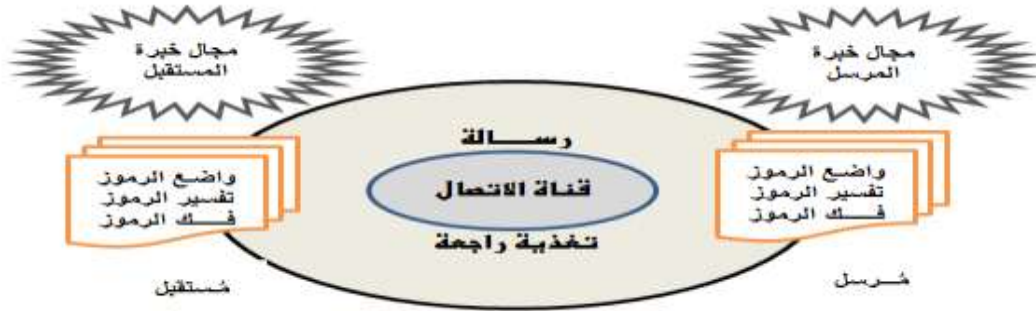
شكل (٢) نموذج ولبر شرام Wilbur Schramm للاتصال الإنساني

من خلال الشكل السابق تتمثل مفاهيم الاتصال فيما يلي: